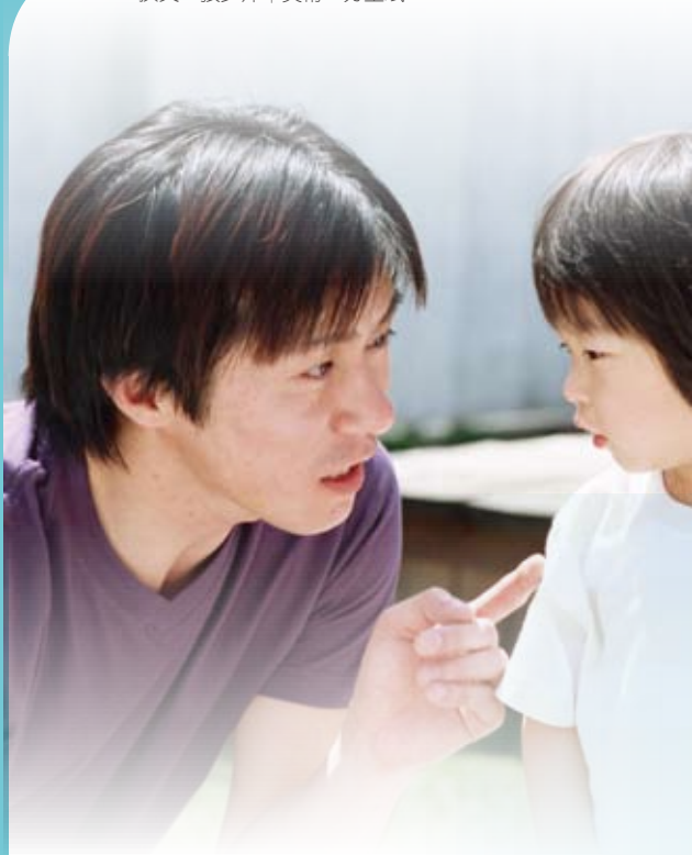
大部分強脊患者為年輕男性，接近24%確診七年內已失去工作能力，這不單對其家庭造成影響，社會的經濟負擔也不少。